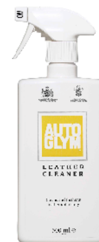
Leather Cleaner ¥1,890- 商品 No. AG25