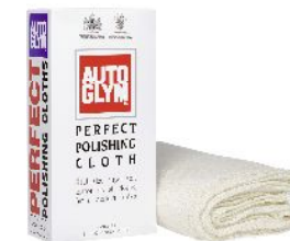
Perfect Polishing Cloth ¥1,470- 商品 No. AG28